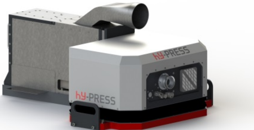
Abb. 3: Das Pressenmodul „hy-PRESS III“ erwärmt hochfestes Blech lokal im Folgeverbundwerkzeug und kann in jede konventionelle Presse integriert werden.

Die lokale Blecherwärmung lässt sich mit dem System „hy-PRESS III“ in konventionelle Prozesse im Folgeverbundwerkzeug integrieren. In der Untersuchung wurde Werkzeug- und Pressentechnik auf Industriestandard verwendet. Darüber hinaus entsprach die für die Untersuchung genutzte Lasertechnik zur Blecherwärmung der des modularen Pressenupgrades hy-PRESS. Eine Übertragbarkeit der Ergebnisse auf industrielle Anwendungen ist so gewährleistet. Aufgrund des Potenzials der laserunterstützten Blechbearbeitung – unter anderem für das Krageziehen - wird am Fraunhofer IPT derzeit eine komplette Fertigungslinie bestehend aus einer 200-t-Servopresse mit Peripherieanlagen für Forschungs- und Entwicklungsvorhaben aufgebaut. Hiermit können in Zukunft weitere Untersuchungen zum laserunterstützten Krageziehen durchgeführt werden.